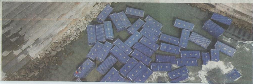
吊籠籍貨輪「天使輪」七月在高雄港外沉沒，多達近六百貨櫃漂流選出，現漏油危機，不過船東擺爛，港公司只好出面協助。

海洋業務陸 【記者吳淑君／台北報導】海洋汙染防治法五月修法後，提高罰款上限，還開設海洋基金，海洋汙染由汙染行為人負責清除，並負擔處理費用，但碰到外國籍的一船公司，船又沉了，就沒輒，遭質疑修法在修假的。台灣海洋大學海洋法律與政策學院院長饒瑞正表示，我國可主張適用公司法上「穿破面紗」原則，長遠而言，是不是政府組改該